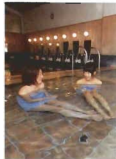
飛騨古川桃源郷温泉 めく森の湯「すば〜ふる」 (日帰り温泉)