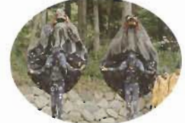
数河獅子 (毎年9月5日)