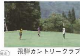
飛騨カントリークラブ