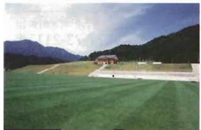
ふれあい広場 総天然芝グラウンド3面・いごの広場