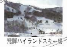
飛騨ハイランドスキー場