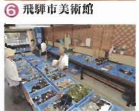
7 三寺めぐり朝市 6月～11月

飛騨市役所観光課 〒509-4292 岐阜県飛騨市古川町本町2-22 TEL 0577-73-2111代 ホームページ: http://www.city.hida.gifu.jp/kanko/ E-mail: syokokanko@city.hida.gifu.jp