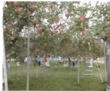
黒内果樹園(飛騨桃・飛騨りんご)