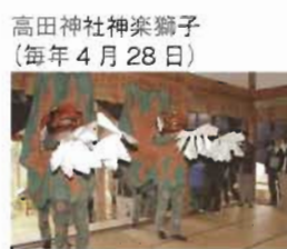
高田神社神楽獅子 (毎年4月28日)